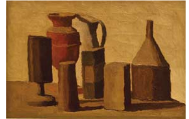
Giorgio Morandi, “Still Life” (“Natura morta”) 1943

The Three Giorgio Morandi Paintings portray the 20th-century painter’s signature types of painting. “Still Life” (“Natura morta”) captures the muted, ascetic world of his singular bottles, then “Flowers” (“Fiori”) the strained emotion of his floral arrangements. The final movement, “Landscape” (“Paesaggio”), leaves the city for a walk in the nearby hills.