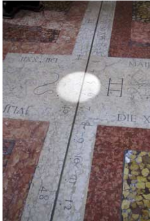
Gian Domenico Cassini, “Meridian Line” (“Linea meridiana”) 1655 Bologna, Basilica di San Petronio

“Fog / Clock Tower” (“Nebbia / Torre dell’orologio”) finds us watching the fog as it slowly clears from the tower on the town hall. “Idea for a Barcarole” again recalls Bologna’s past as a city of canals, when maybe a boatman or two might have been inclined to sing a barcarole.